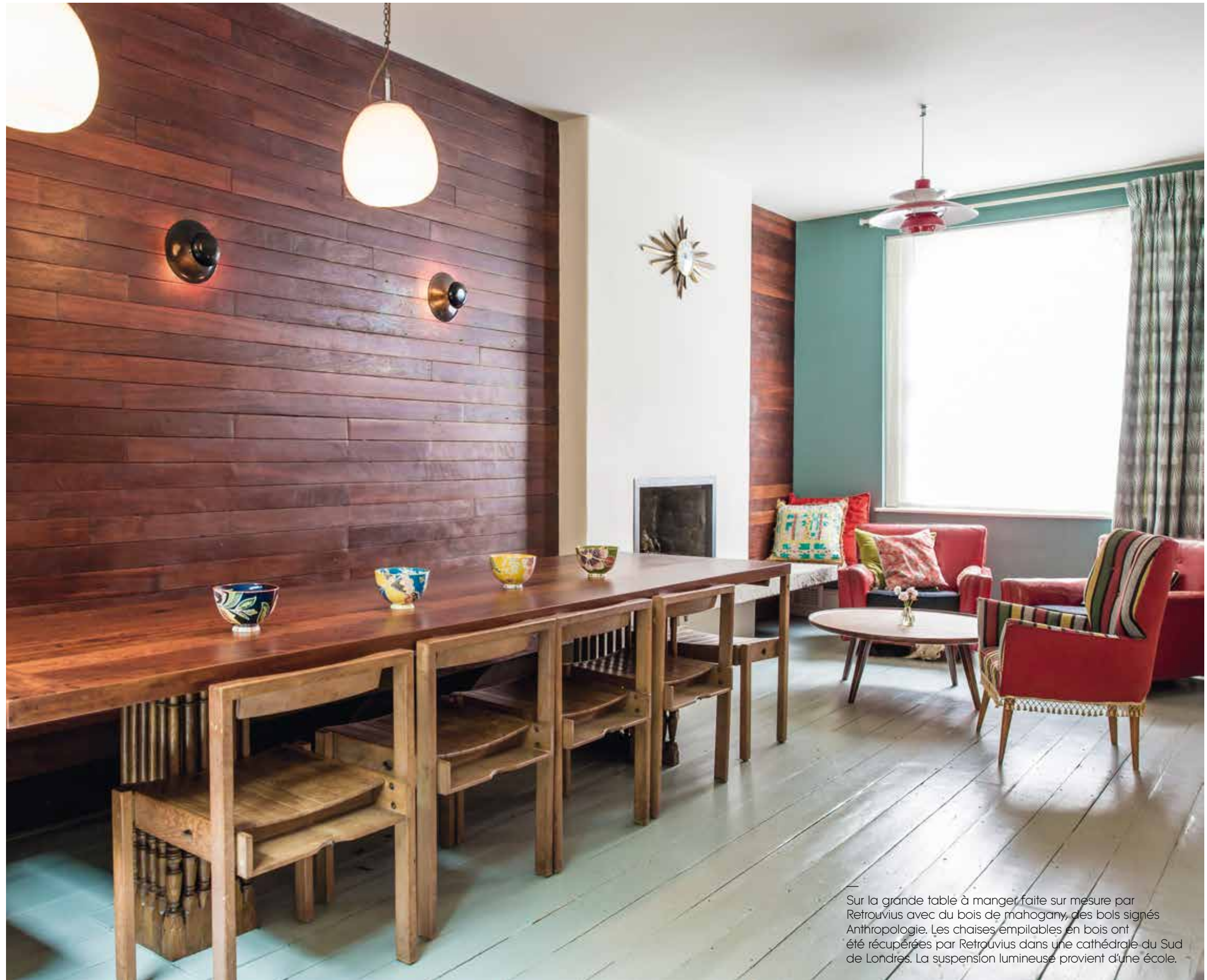
Sur la grande table à manger faite sur mesure par Retrouvius avec du bois de mahogany, des bols signés Anthropologie. Les chaises empilables en bois ont été récupérées par Retrouvius dans une cathédrale du Sud de Londres. La suspension lumineuse provient d'une école.

— TEXTE : VANESSA BOZ PHOTOS : LOUISE DESROSIERS - STYLE : ISIS-COLOMBE COMBRÉAS