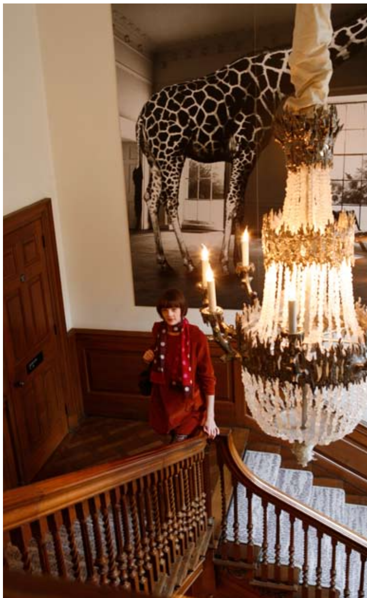
Une grande girafe surveille le Mansion main staircase.

Visiter la National Portrait Gallery pendant que les enfants rigolent sous l'œil attendri d'une nanny anglaise, voilà une bonne raison pour sauter dans l'Eurostar au printemps. La campagne anglaise n'est plus qu'à trois heures de Paris, et à moins de 40 minutes du centre de Londres. L'hôtel The Grove, c'est la grâce de Stella Tennant et le glamour d'Elizabeth Hurley. Soyez l'invité douillet d'une propriété de 300 hectares en bordure de Londres.